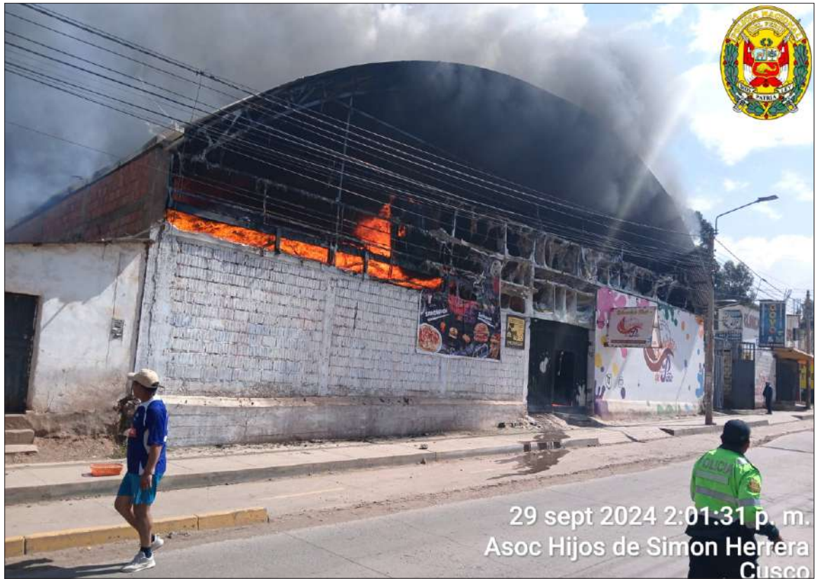
29 sept 2024 2:01:31 p. m. Asoc Hijos de Simon Herrera CUSCO

Personal de la comisaría de San Sebastián brindó apoyo en las labores de seguridad, resguardando a las personas que se encontraban cerca del lugar mientras se sofocaba el fuego. Agentes de patrullaje a pie fueron los primeros en llegar al lugar y coordinaron