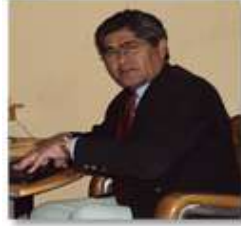
Escribe: Lic. Enrique R. Aguirre Castro Consultor en Comunicación y Gestión Pública *

La Política Nacional de Integridad y Lucha contra la Corrupción aprobada mediante Decreto Supremo N° 092-2017-PCM, mantiene como objetivo general "Contar con instituciones transparentes e íntegras que practican y promueven la probidad en el ámbito público, sector empresarial y la sociedad civil; y garantizar la prevención y sanción efectiva de la corrupción a nivel