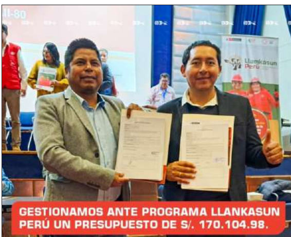
GESTIONAMOS ANTE PROGRAMA LLANKASUN PERÚ UN PRESUPUESTO DE S/. 170.104.98.

La ceremonia se realizó en la Ciudad Imperial Cusco en presencia de Jefe de la Unidad Territorial Cusco-Madre de Dios y el equipo técnico de Llankasun Perú. Con este convenio, la Municipalidad Distrital de Colquemarca reafirma su compromiso con el desarrollo sostenible y el mejoramiento de la calidad de vida de sus habitantes, dando pasos firmes hacia un futuro más luminoso y prometedor para todas las comunidades involucradas.